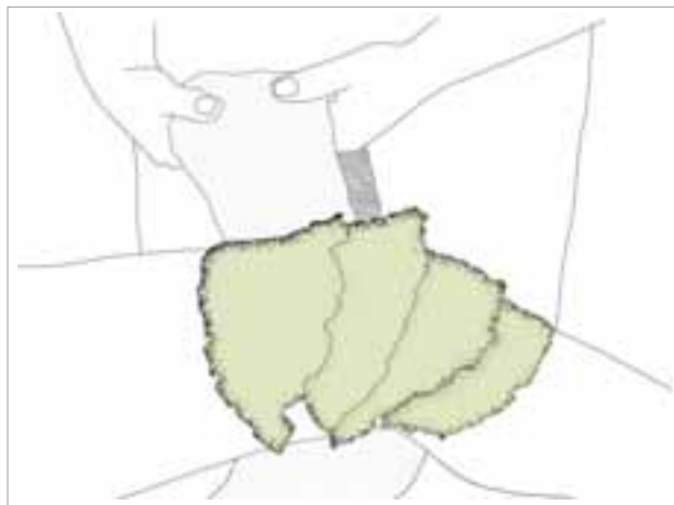
Der Gelenkwickel mit Kohl